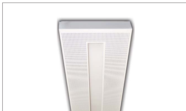
LED-Leuchte 481 HCL in Metallkassette LED-lighting 481 HCL in ceiling tile