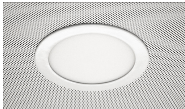
LED-Panel in Metallkassette LED-Panel in ceiling tile