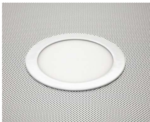
LED-Panel in Metallkassette LED-Panel in ceiling tile