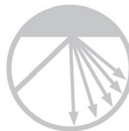
PARZIFAL®-Effekt: diffuse Lichtreflexion ohne Spiegelung

Mehr Informationen und die Möglichkeit zur Musteranforderung finden Sie unter: