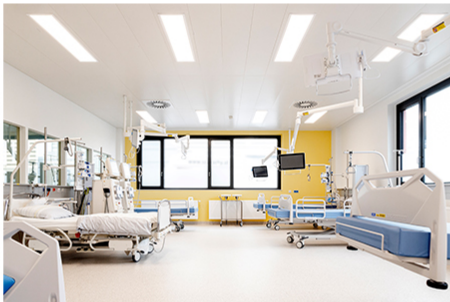
Salzkammergut Klinikum Vöcklabruck