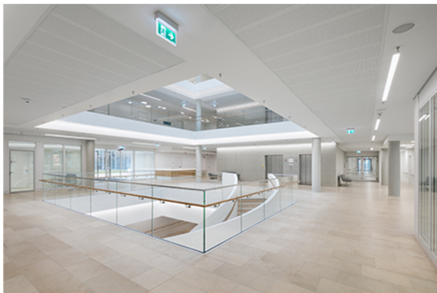
BG Klinika Berlin